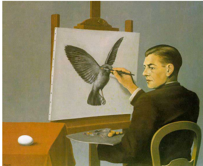
René Magritte, Autoritratto (Chiaroveggenza) , 1936

Simbolicamente amo rappresentare l'attività del formatore, dell'educatore con un quadro di Magritte: